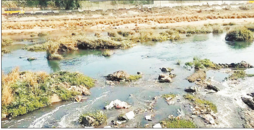
का पानी आकर सीधे केलो में मिलता हुआ नजर आ रहा है। वहीं शनि मंदिर के समीप स्थापित

गौरतलब है कि ठेका कंपनी इन्वॉयर्स इंफ्रा को शहर के 15 किलोमीटर क्षेत्र में केलो नदी में मिलने वाली नाली व नाले के पानी को सीवरेज ट्रीटमेंट प्लांट तक ले जाने के लिए पाइप लाइन बिछाना था, लेकिन नगर अज भी शहर के अंदर देखा जाए तो कई स्थानों पर नाले